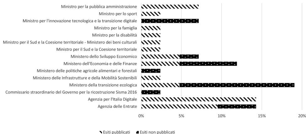
Grafico 6.2 – Pubblicazione degli esiti delle consultazioni pubbliche svolte dalle amministrazioni centrali e dalle Agenzie. Anno 2021.